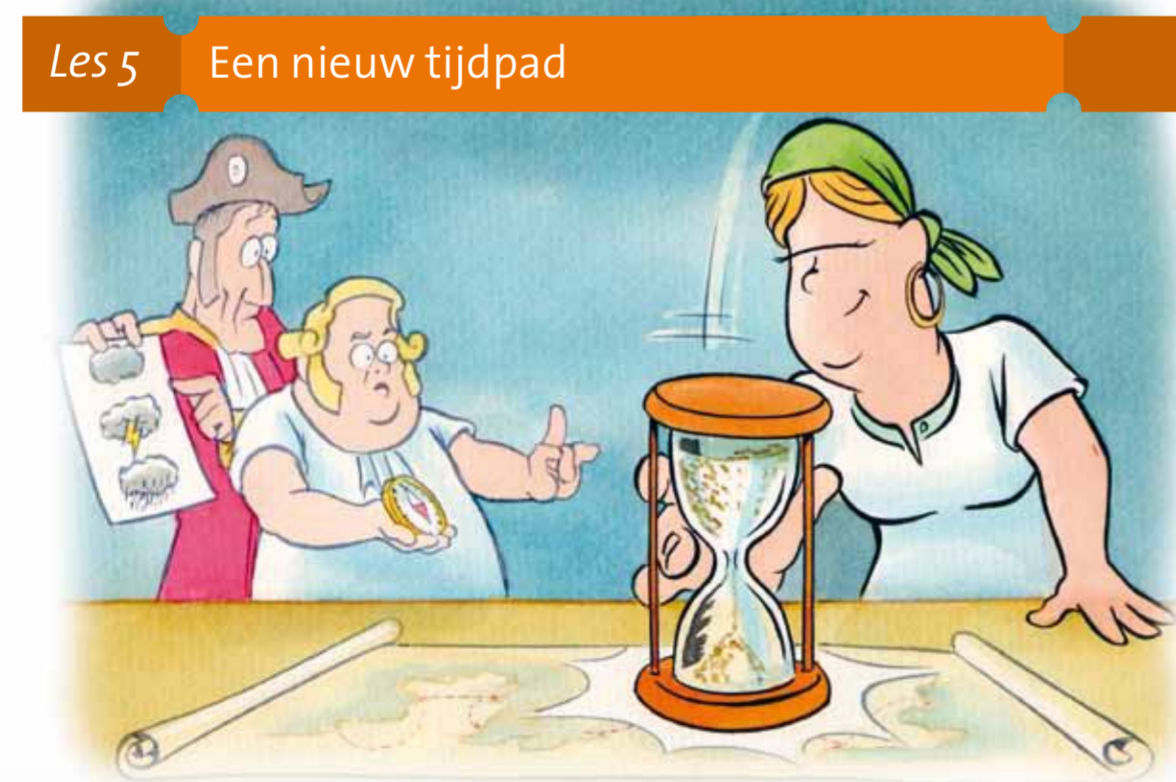
Les 5 Een nieuw tijdpad