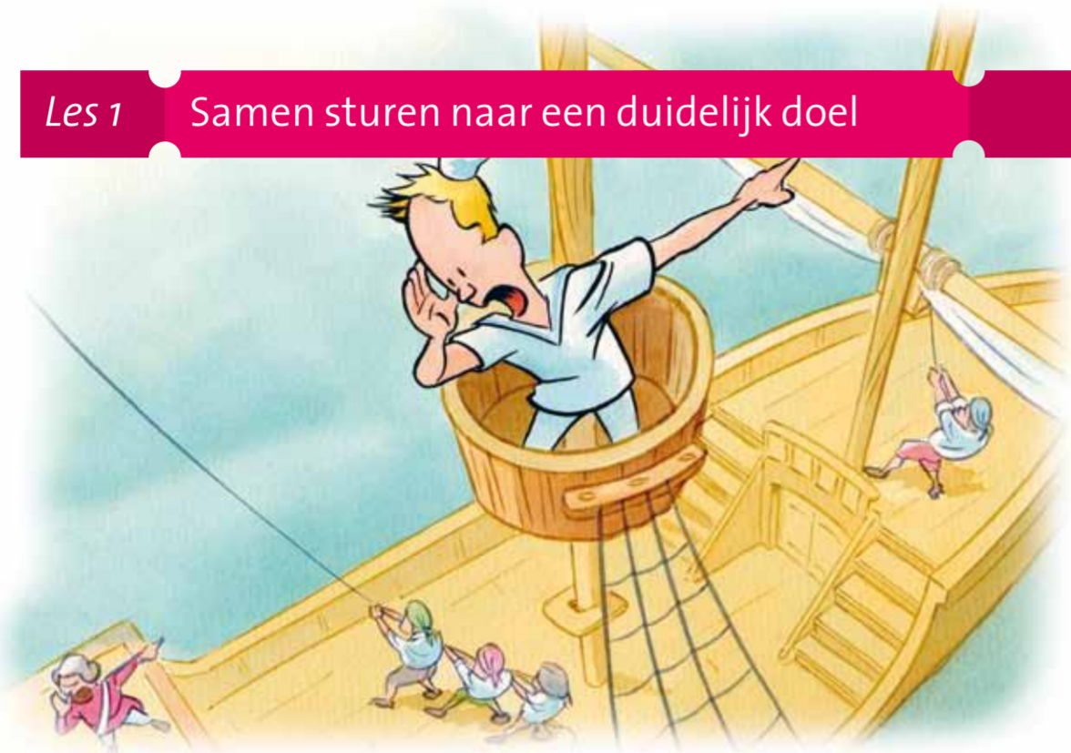
Les 1 Samen sturen naar een duidelijk doel