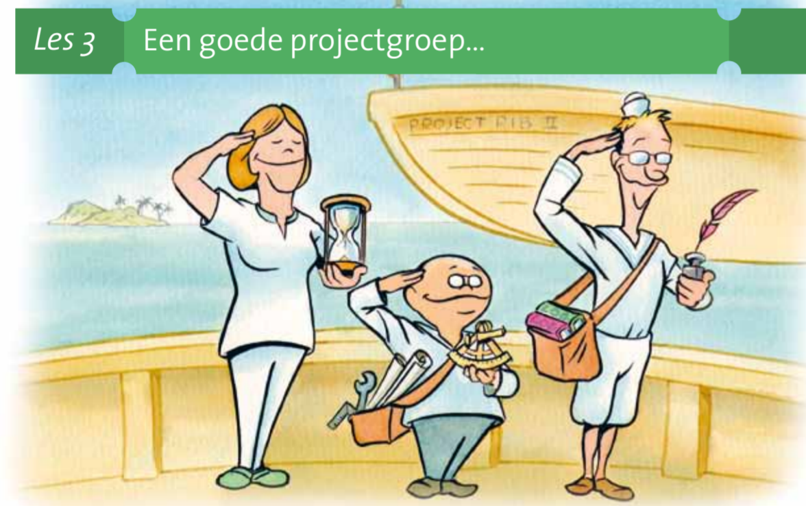
Les 3 Een goede projectgroep...