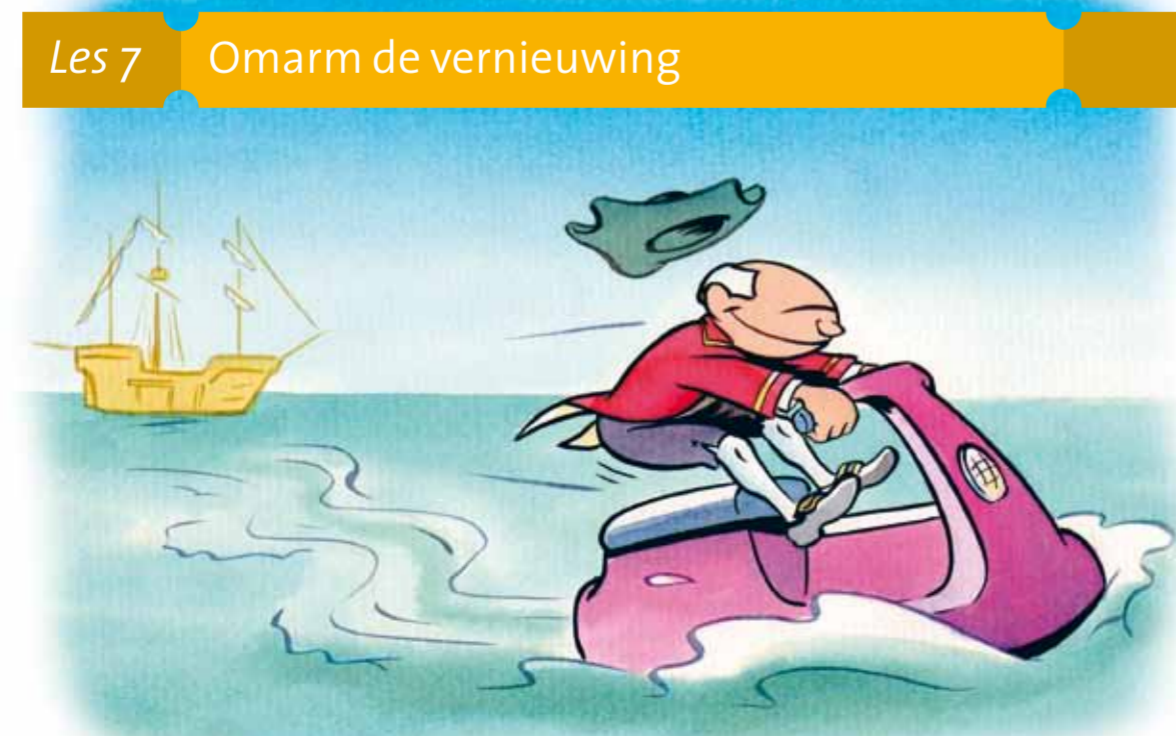
Les 7 Omarm de vernieuwing