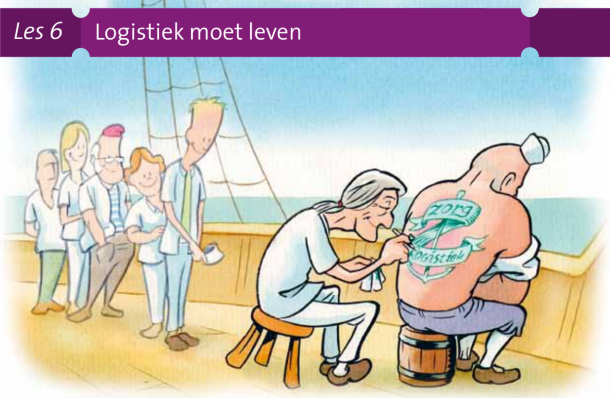
Les 6 Logistiek moet leven