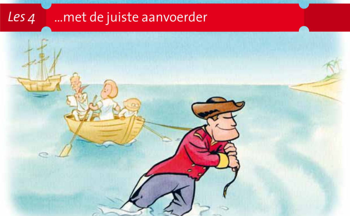
Les 4 ...met de juiste aanvoerder