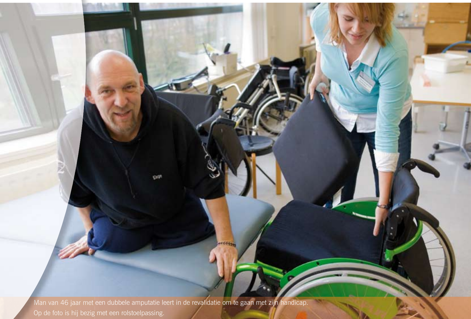
Man van 46 jaar met een dubbele amputatie leert in de revalidatie om te gaan met zijn handicap. Op de foto is hij bezig met een rolstoelpassing.