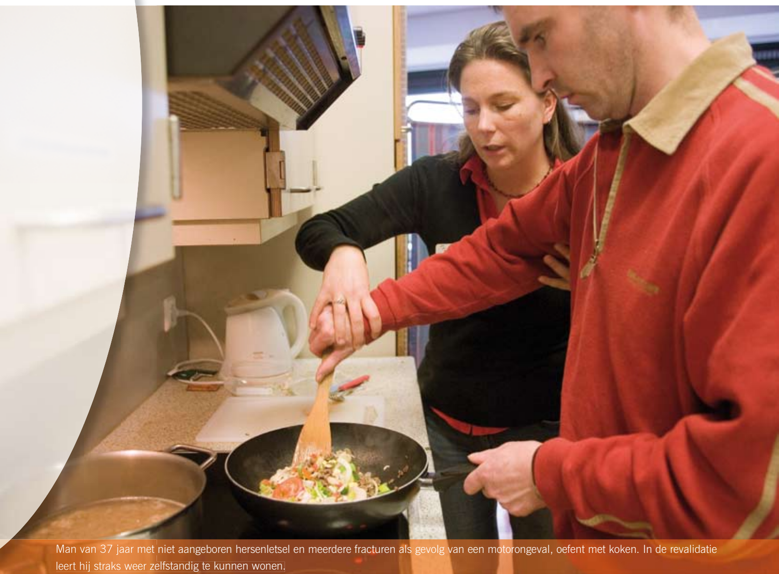
Man van 37 jaar met niet aangeboren hersenletsel en meerdere fracturen als gevolg van een motorongeval, oefent met koken. In de revalidatie leert hij straks weer zelfstandig te kunnen wonen.