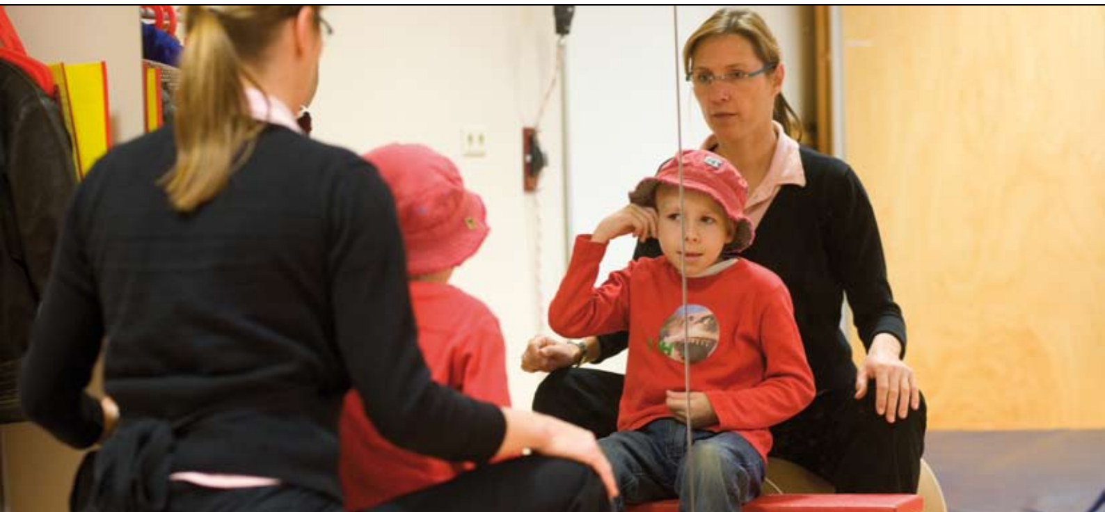
Jongen van 10 jaar met een partiele dwarslaesie. Hij oefent met het goed opgestrekt zitten en het zelf in- en uitdoen van zijn gehoorapparaat. Daarnaast werkt hij tijdens de ergotherapie aan zelfverzorging en de fijne motoriek.

definitief onderzoeksvoorstel in te dienen. In 2007 wordt besloten welke drie onderzoeksprojecten uitgevoerd kunnen gaan worden met financiering vanuit het IIe Programma Revalidatieonderzoek.