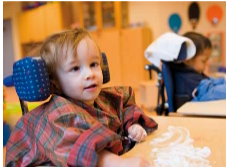
Jongetje van 1,5 jaar met een bewegingsstoornis van de hersenen (cerebrale parese), leert basisvaardigheden om zo zelfstandig mogelijk te kunnen functioneren. Hij doet oefeningen met scheerschuim ter stimulatie van de senso-tactiele informatie.

Revalidatie Nederland kan zich vinden in een eventuele overheveling, mits gewaarborgd is dat voldoende financiële middelen vanuit de AWBZ worden overgeheveld naar de Zorgverzekeringswet, waarmee ook de toekomstige vergrijzing en de daarmee samenhangende zorgbehoefte met toekomstige aanspraken op revalidatie voldoende gefinancierd kunnen worden. De overheveling mag niet ten koste gaan van de huidige aanspraak op revalidatie in de basisverzekering, gezien zowel het grote patiëntenbelang als het maatschappelijke belang van de specialistische revalidatie.