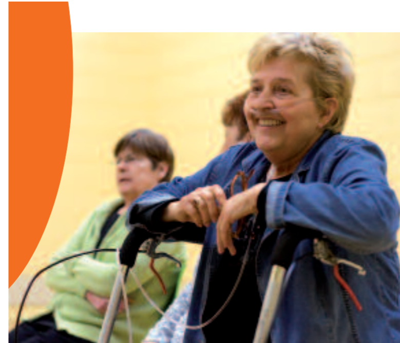
Vrouw (63 jaar) met een chronische obstructieve longziekte (COPD). Zij verbetert haar conditie op de dagbehandeling longrevalidatie.

Revalidatie Nederland biedt de hoofdinspecteur Curatieve zorg van de Inspectie voor de Gezondheidszorg (IGZ) namens haar leden een landelijke inventarisatie aan van de positieve resultaten van het verbetertraject dat door Revalidatie Nederland is ingezet direct na het IGZ-onderzoek naar basismedische zorg in 2003. Revalidatie Nederland onderschrijft het belang van een goede organisatie en verankering van basismedische zorg binnen de instellingen, mede gezien het toenemend aantal patiënten met co-morbiditeit. Niet zonder reden vermeldt het in 2004 door de IGZ uitgebrachte onderzoeksrapport: "Opmerkelijk gevolg van het onderzoek is dat vele categorale ziekenhuizen, verenigd in Revalidatie Nederland en de Nederlandse Vereniging van Revalidatieartsen (VRA), hiertoe aangezet door het Inspectieonderzoek, al ruim voor het verschijnen van het rapport een verbetertraject hebben ingezet."